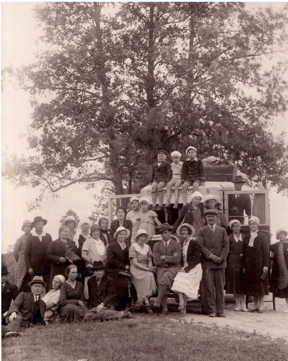
Foto on tehtud 1934. aastal, kui Rakvere kogudus sõitis Pärnusse konverentsile.

PEAKOOSOLEKUD, NIMETATUD KA KONVERENTSIDEKS, EI OLNUD AINULT ARUANDE- VALIMISKOOSOLEKUD, VAID OLID EESTI ADVENTRAHVALE TÕELISTEKS PIDUPÄEVADEKS, KUS LISAKS KÕIGELE MUULE TUGEVDATI ADVENTRAHVA ÜHEPERETUNNET.